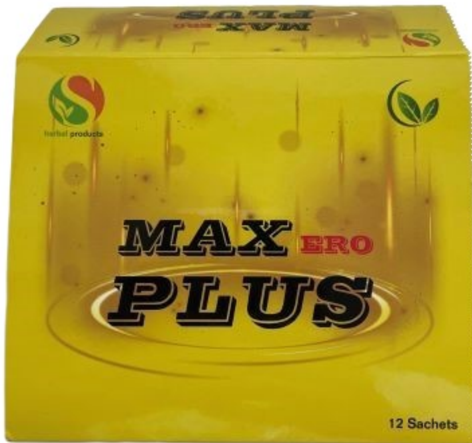
Fig.1: Imagen del producto MAX ERO PLUS