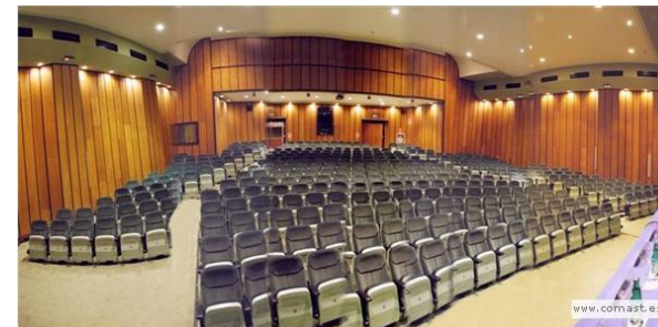
Salón de actos del Colegio de médicos en Oviedo

La Semana de Impulso TIC celebrará la Jornada de la informática en el ámbito sanitario en las instalaciones del Colegio Oficial de Médicos de Asturias en Oviedo, donde los asistentes además de asistir a las charlas, dispondrán de visita a stands de empresas que están desarrollando tecnología en esta área de conocimiento.